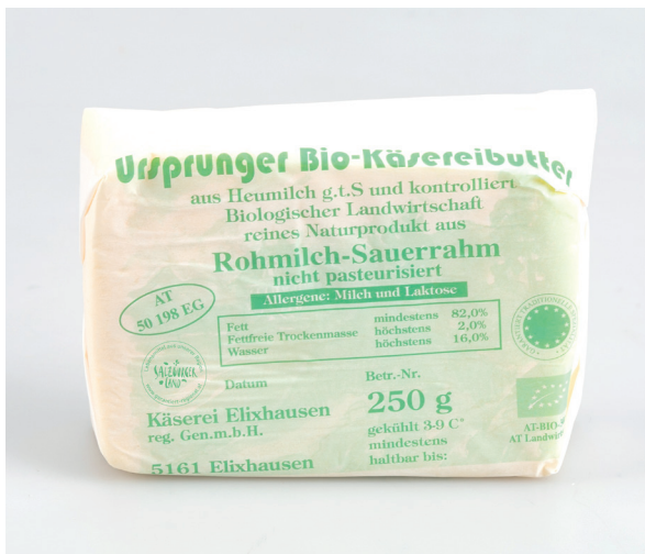
Anwendung 1c mit Rand