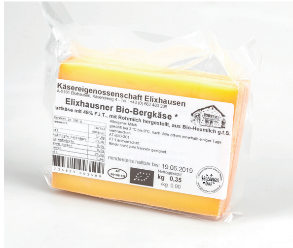
Anwendung s/w mit Rand