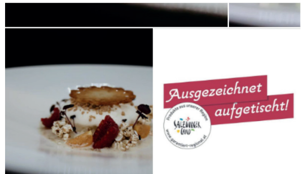
Du und 100 weitere Personen