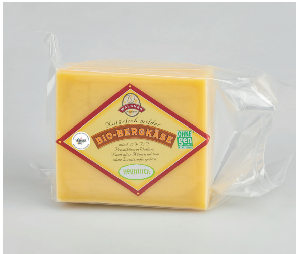
Anwendung 4c ohne Rand